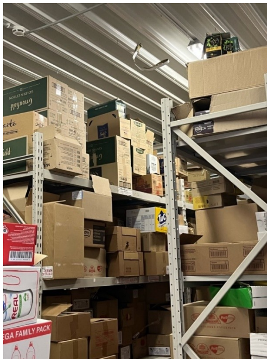
Рисунок 10 – Стеллажи на складе

Склад оснащен противопожарной сигнализацией и автоматической системой тушения огня. Так же располагается термометр для соблюдения температурного режима и допустимых показателей влажности воздуха.