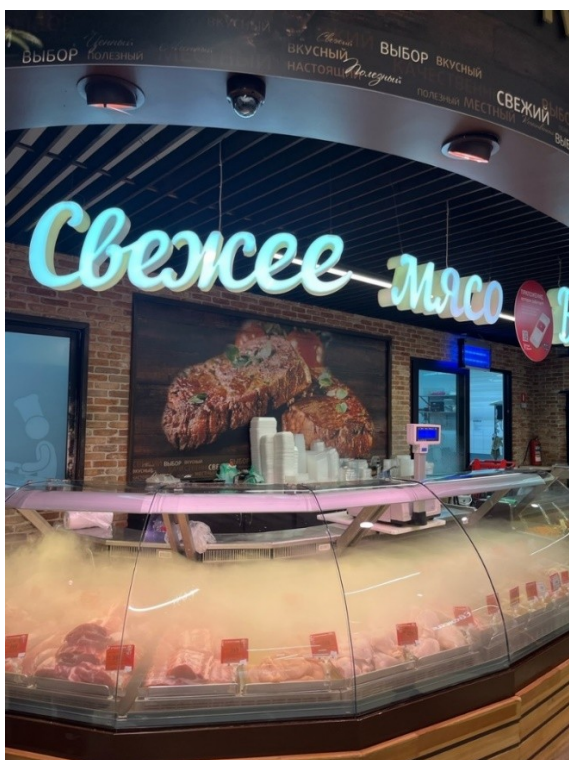
Рисунок 11 – Мясной прилавок