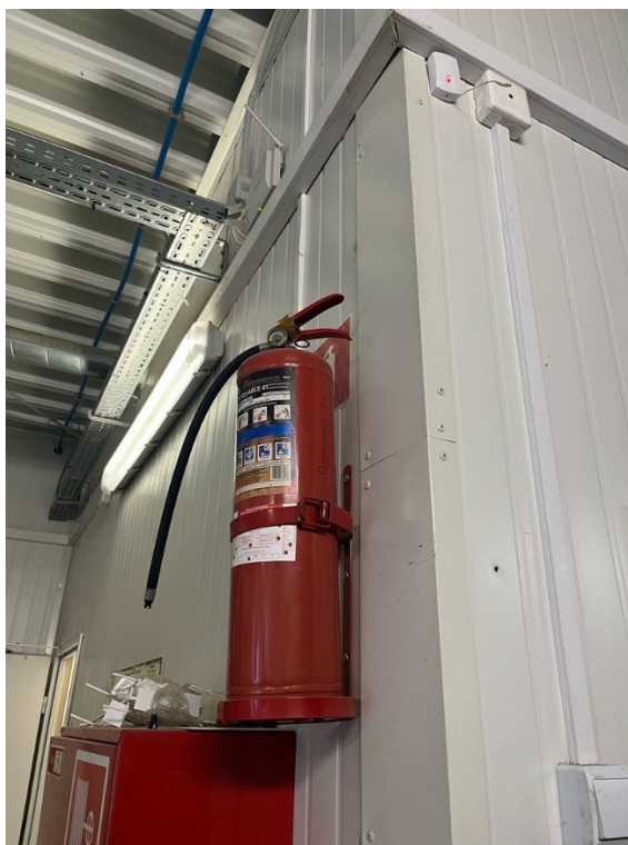
Рисунок 4 - Огнетушитель

В супермаркете для сотрудников действует пропускной режим в подсобные помещения. Перед началом рабочего дня все сотрудники отмечают в журнале время прихода, а в конце рабочего дня - время ухода.