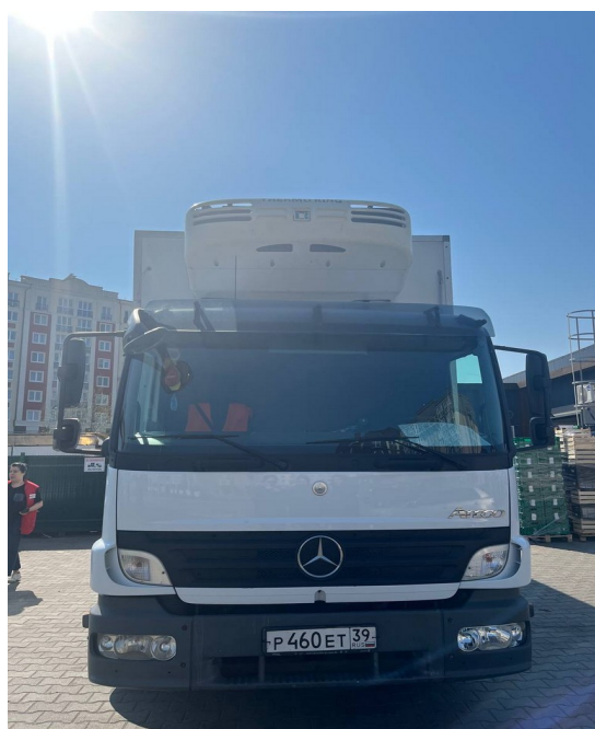
Рисунок 9 – Транспортировка товара

Поставщики привозят товар на специальных машинах (рисунок 9), некоторые специализируются именно под заморозку или же под что-то иное.