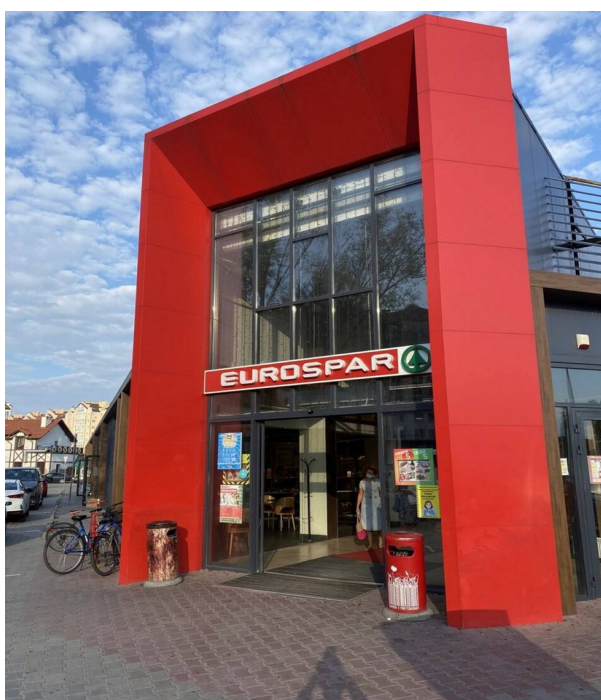
Рисунок 1- Внешний вид торгового комплекса «EUROSPAR №73 »

EUROSPAR №73 был открыт 8 сентября 2017 года и имеет площадь магазина почти 900 квадратных метров. (Рисунок 1).