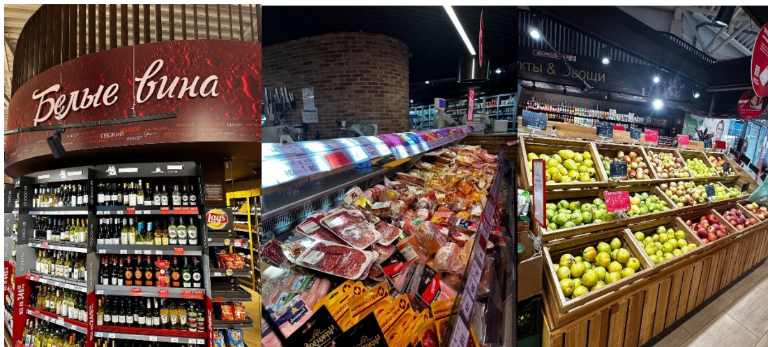
Рисунок 2 - Ассортимент супермаркета «EUROSPAR №73»

Типовая организационная структура торговом центре «EUROSPAR № 73» в Зеленоградске (рисунок 3).