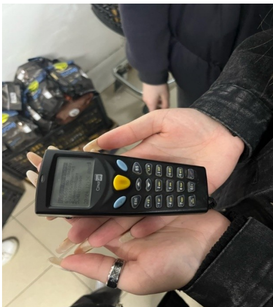
Рисунок 7 - ТСД

При поступлении товаров от поставщика ведётся приёмка. Приемка товара совершается посредством терминала сбора данных - ТСД (рисунок 7). Используя операцию «Поступление», приемщик загружает в ТСД существующий документ, делая электронную накладную. И только после окончательной приёмки и сравнения данных товары могут быть отправлены на склад или по необходимости сразу в зал.