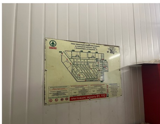
Рисунок 5 - План эвакуации