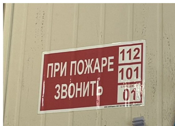
Рисунок 6 - телефоны экстренных служб