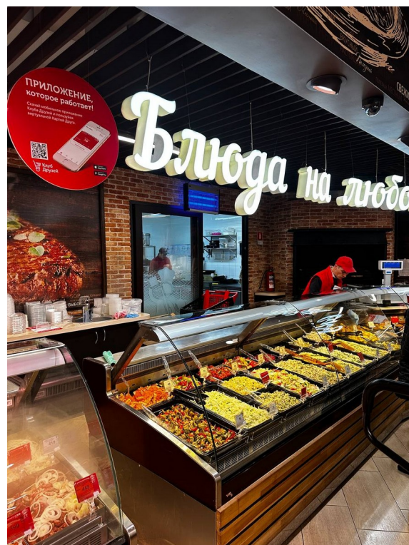
Рисунок 12 – Прилавок готовой продукции